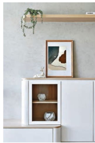
■大廳的簡約裝飾收納櫃和花架。