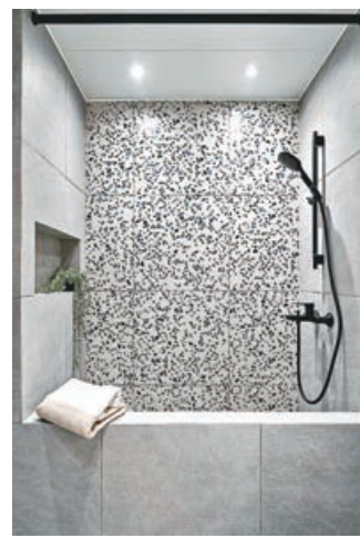
■浴室特設的麻石牆身淋浴企缸。