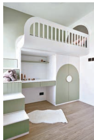
■孩子的睡房以淺白和淺綠色作配搭。