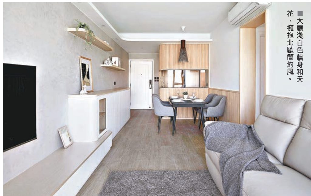
■大廳淺白色牆身和天花，擁抱北歐簡約風。