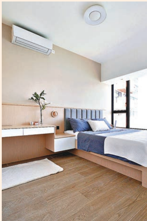
■主人房採用大地色系傢具。