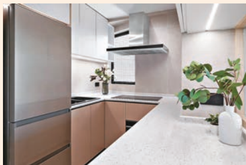
■廚房配以白色長形麻石煮食枱。