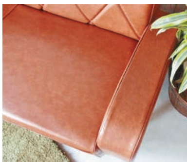
■日系梳化兩邊扶手不佔位。

形日居有售，價格極優惠，體貼度滿分的日本製 Cello Sofa，絕對是一張能表達日本工藝細緻度的貼心設計，典雅十足的菱形手工拉線靠背，恰當的高度，不佔位的左右扶手，4個尺寸，5種皮色，各方面的配合下，構成 Cello Sofa 能長踞日本傢具市場熱銷的前列位置。