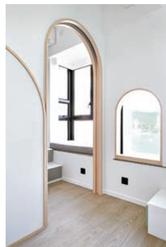
■開放式房間和窗戶都採用北歐圓拱形風格。