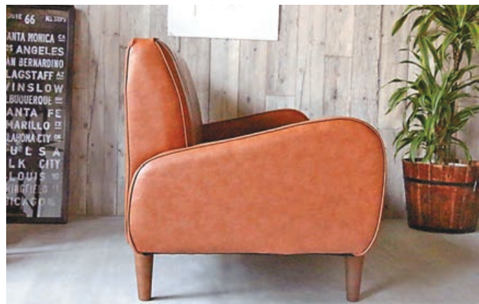
■日系梳化高度適中。