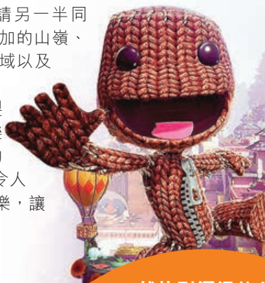
《小小大冒險》畫風治癒可愛。

除了遊戲畫面本身，遊戲音樂製作精良，你可以從中發現許多經典樂曲改編，需要跟隨 Mark Ronson 的《Uptown Funk》節奏跳躍和戰鬥，令人忍不住邊玩邊隨著音樂擺動，非常歡樂，讓愛侶能夠輕鬆體驗妙趣橫生的關卡。