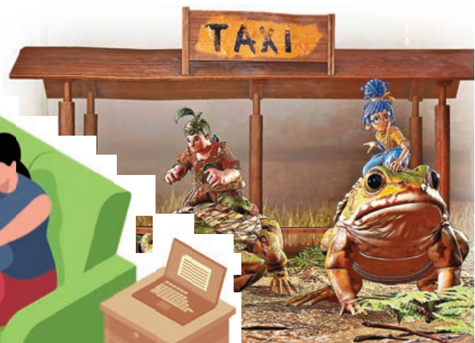
天馬行空的關卡設計充滿童趣。

遊戲中插入許多情侶真實遇到的現實情節，溫馨感人的故事讓這隻冒險遊戲脫穎而出，當情侶一起遊玩時一定能觸發不少共鳴回憶。遊戲天馬行空的設計讓冒險充滿歡樂，比如科迪能夠在牆上固定釘子，小梅則可以用自己能力攀爬釘子。在某個關卡，科迪需要駕駛飛機飛過樹頂，小梅則需要在機翼上與松鼠黑幫展開格鬥對決。這些獨特的玩法機制，絕對讓玩家玩得停不下來。