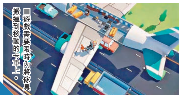
遊戲需要限時內將傢具搬運到移動的卡車上。

在遊戲的快節奏和引發的雞飛狗走中，和另一半盡情大笑出聲，就達到了遊戲的目標。在下周三（8月16日），《Moving Out 2》將會上線，還未入手的玩家，不如耐心等待，感受最新的《Moving Out》系列。