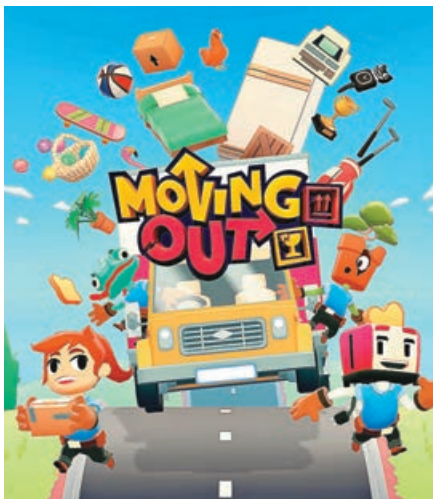
雞飛狗走的《Moving Out》，一定讓你笑出聲。