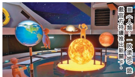
《人類：一敗塗地》遊戲官方持續推出新關卡。

這款2016年發布的遊戲不時推出免費的新關卡回饋玩家，除此之外，在創意工坊，有不少玩家自製關卡，讓你每次打開遊戲都能嘗試新挑戰，絕對物超所值！