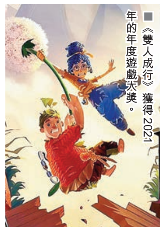
《雙人成行》獲得2021年的年度遊戲大獎。

專為雙人合作遊玩打造的《雙人成行》，自2021年發布，一直被認為是情侶必玩的遊戲。遊戲主角是一對經常互相爭執的夫妻科迪和小梅，因為魔法變成了女兒的玩偶，兩人被困在一個變幻莫測的奇幻世界中，需要通過彼此幫助跨越各種意外障礙，理解彼此的困難與想法，在冒險旅途中挽救他們破碎的感情。在《雙人成行》中唯一能確定的是「兩人同心，其利斷金」。