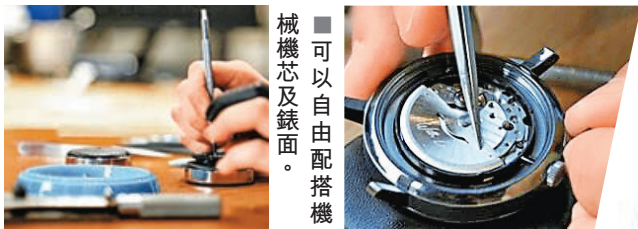
■可以自由配搭機械機芯及錶面。