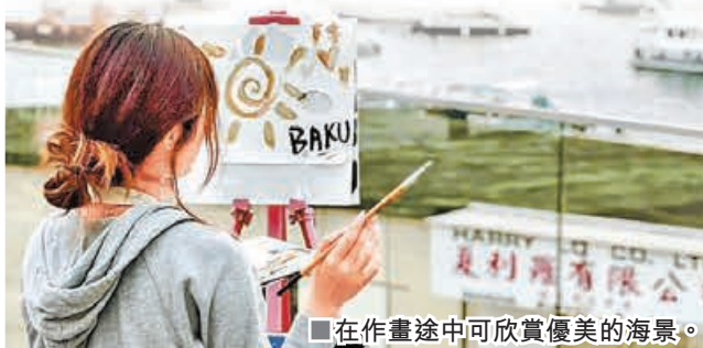
■在作畫途中可欣賞優美的海景。

位於西貢白沙灣的BAKU八古，由即日起至12月31日，推出「3小時自由繪畫工作坊」，使用TapNow獨家優惠每位380元體驗西貢戶外自由繪畫，享受創作時光，任你發揮創意，以藝術創作治癒身心靈。工作坊方案包括顏料、用具、畫布框（30x30cm），每位參加者會額外送花茶。工作室處於極佳的地理位置，讓大家在作畫途中可欣賞優美的海景及開揚天空，一掃所有煩惱。工作坊由星期一至日都會開班，12人起預訂，更可以包場。