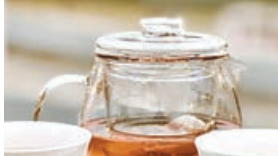
■每位參加者會送花茶。

位於西貢白沙灣的BAKU八古，由即日起至12月31日，推出「3小時自由繪畫工作坊」，使用TapNow獨家優惠每位380元體驗西貢戶外自由繪畫，享受創作時光，任你發揮創意，以藝術創作治癒身心靈。工作坊方案包括顏料、用具、畫布框（30x30cm），每位參加者會額外送花茶。工作室處於極佳的地理位置，讓大家在作畫途中可欣賞優美的海景及開揚天空，一掃所有煩惱。工作坊由星期一至日都會開班，12人起預訂，更可以包場。