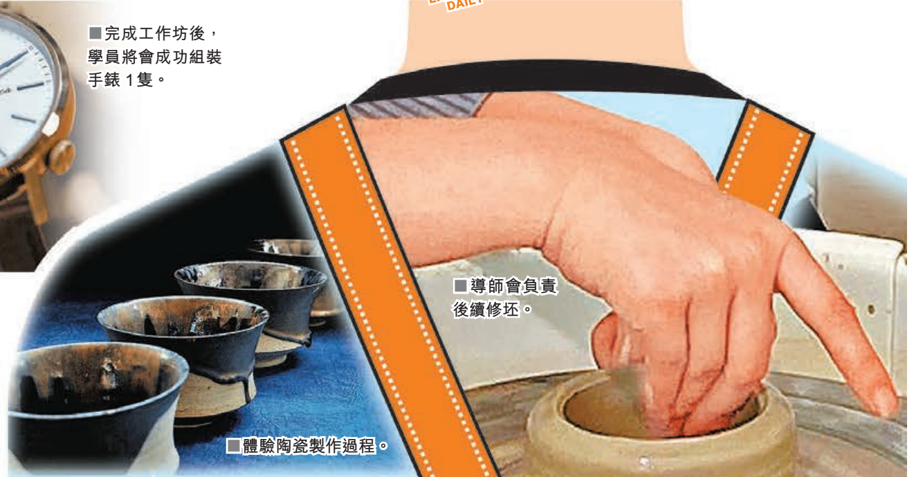
■導師會負責後續修坯。