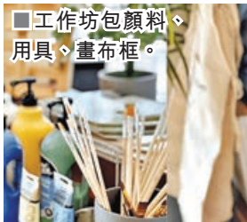
■工作坊包顏料、用具、畫布框。