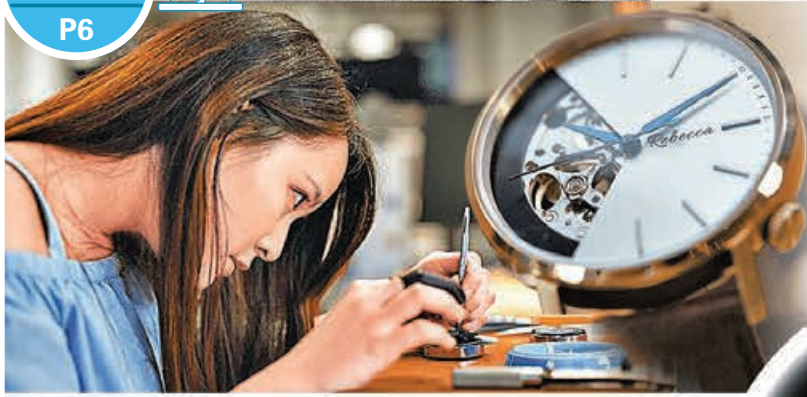
■完成工作坊後，學員將會成功組裝手錶1隻。