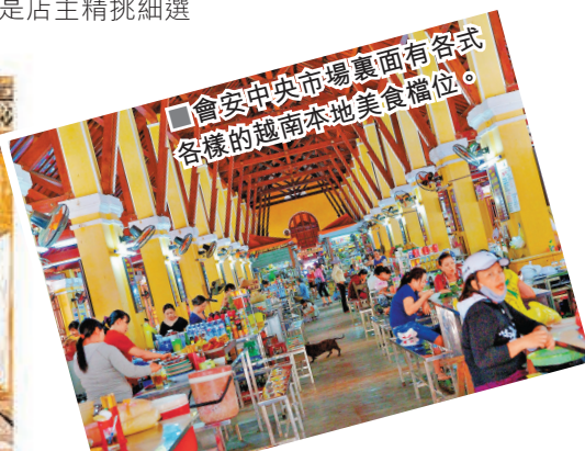
■漫步已有200多年歷史的「進記」老宅，別有一番滋味。