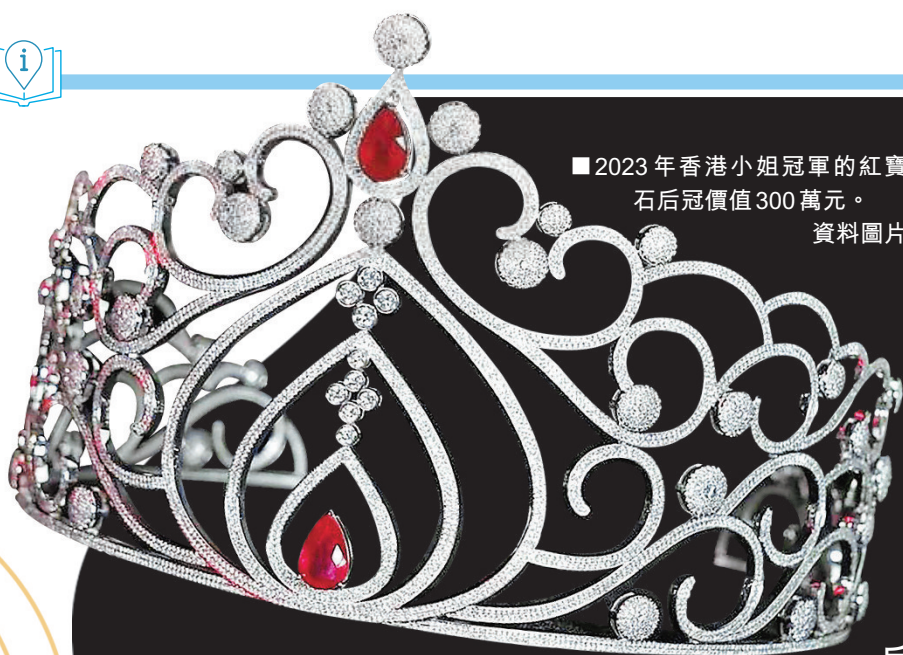
■ 2023年香港小姐冠軍的紅寶石后冠價值300萬元。