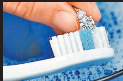
■ 一般可用牙刷沾上肥皂溶液清潔鑲飾。

這是大家經常遇到的問題，好消息是鑽石永遠不會變朦朧。但是，隨著時間的推移，污垢和污垢的堆積，大家的鑽石可能會呈現出薄膜污積。因為鑽石內部永遠不會變得混濁，所以任何污積都是純粹的表面，可以通過清潔去除。