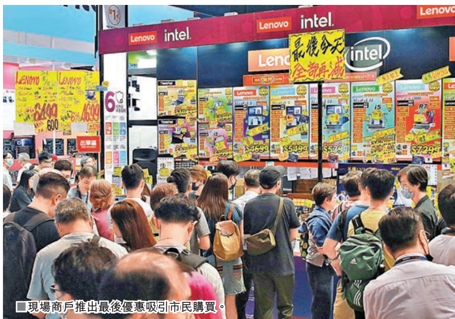
現場商戶推出最後優惠吸引市民購買。

一連四天的「香港電腦通訊節」昨晚6時在灣仔會展圓滿閉幕。活動來到最後一天，大部分商戶都劈價清貨，部分更減價近六折促銷，吸引大批市民把握最後機會執平貨，使現場人山人海。大部分受訪參展商表示，滿意今年銷情，有商戶預料今屆銷售額錄得兩成的按年增幅。主辦單位表示，今年人流量與往年相若，但整體銷售額增長15%，今次是復常通關後首個電腦通訊節，內地旅客入場人數明顯增加。