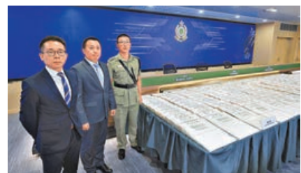
香港海關檢獲約240公斤懷疑冰毒。中社社

海關毒品調查科將藏毒的人造皮革貨物還原及展開監控遞送，發現販毒集團掩飾準備將貨物運往悉尼目的地，海關於是再聯絡澳洲執法機關採取聯合監控遞送行動。本月13日藏毒的人造皮革抵達悉尼，即由澳洲執法人員接手監控遞送，同月23日在悉尼拘捕販毒集團一名負責處理貨物的骨幹成員。另一方面，香港海關亦於本月24至25日展開行動，拘捕3名男疑犯。海關指案件仍在調查中，不排除更多人被捕。