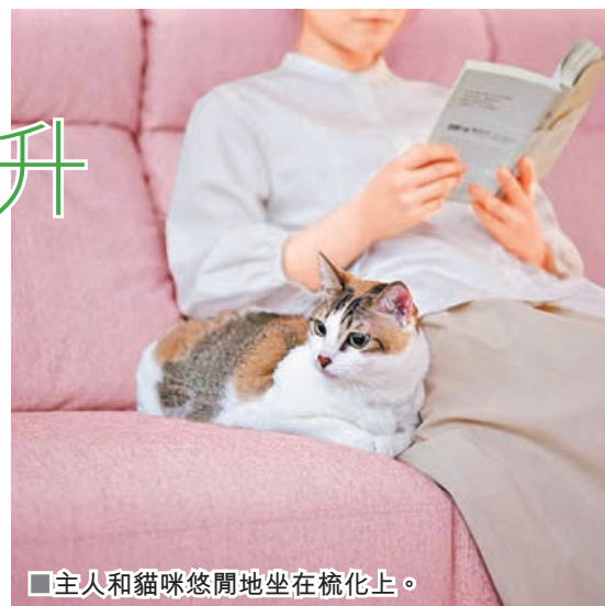
■主人和貓咪悠閒地坐在梳化上。