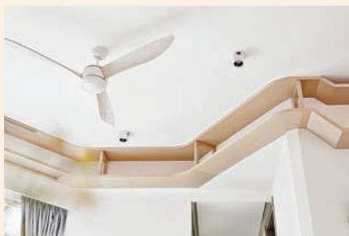
■大廳上角架設了一條長長的貓咪空中走廊。