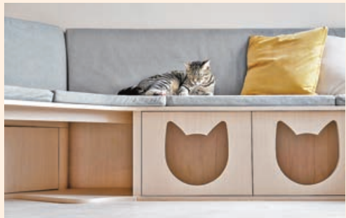
■梳化下的收納櫃變身小貓休憩地方。