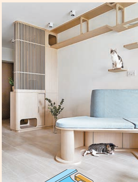
■客飯廳到處都有小貓休息的地方。