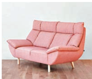
■寵物梳化在功能上大大地提升了。