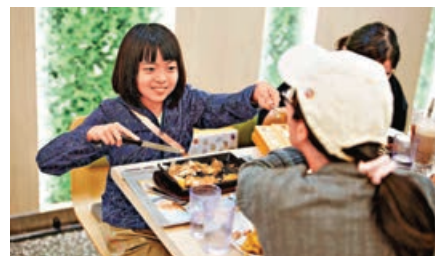
■集團邀請了照顧者及其家人一同享用鐵板餐。

輔導會作為「大家開飯2023」之合作夥伴，甄選其網絡下符合資格會員接受資助，包括兒童、長者及殘障人士的照顧者。期望能減輕照顧者的生活開支壓力，同時讓他們可以騰出空間及時間照顧自己身心需要。集團更會定期為受助人士舉辦聚餐活動，讓照顧者擴闊社交圈子，認識同路人，彼此扶持。