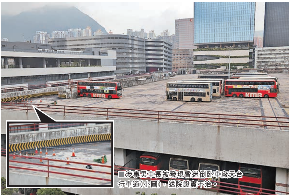
■涉事男車長被發現昏迷倒臥車廠天台行車道(小圖)，送院證實不治。

九龍灣九巴車廠昨發生奪命事故。一名男車長清晨取車期間，在車廠天台被同事所駕巴士撞倒，兩小時後才被發現頭及腳部重創昏迷倒臥車廠天台行車道，送院證實不治。警方調查後相信，肇事的九巴司機在倒車時撞倒事主，之後駕車離開，被警方以涉嫌危險駕駛引致他人死亡等三罪拘捕。九巴對事件感到非常難過和哀痛，向死者家屬致以最深切慰問及提供一切適切的協助，並全力配合警方調查。