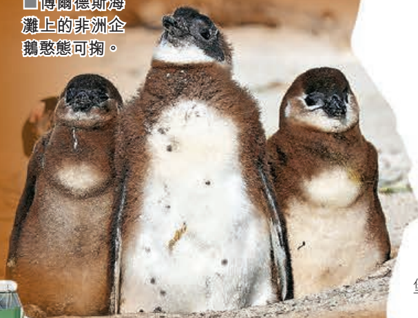
■博爾德斯海灘上的非洲企鵝憨態可掬。

不過，西蒙鎮最吸引人的當屬博爾德斯海灘，這個海灘也被稱之為「企鵝海灘」，因為這裏生活着數以千計的非洲企鵝，每年全世界約有30萬遊客來這裏觀賞牠們。在潔淨的海灘上，這些企鵝與人類和諧共處，就像是這裏的主人一樣，悠然自得地衝浪、戲水、覓食，在沙灘上享受溫暖陽光。為了讓更多的遊客可以玩得舒心，小鎮上設有不同級別的酒店、旅館、餐館、咖啡館等，讓遊客在遊玩的同時也可享受到舒適的用餐和住宿環境。