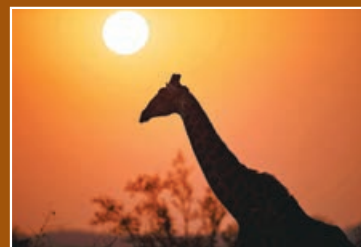
■克留格爾國家公園內的長頸鹿。