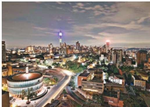
■約翰內斯堡的美麗城市夜景。