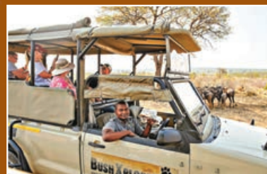
■在南非克留格爾國家公園，遊客乘坐越野車觀看動物。