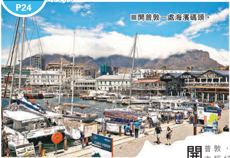
■開普敦一處海濱碼頭。