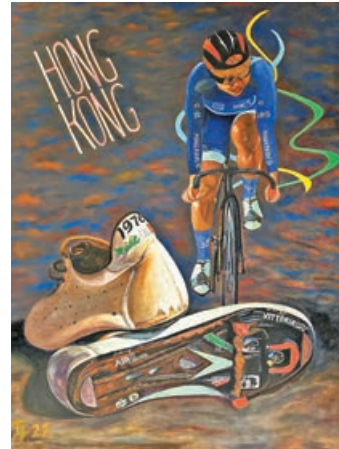
■ 前頂尖場地單車運動員李慧詩的賽鞋。