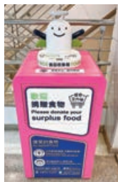
■吃不完的月餅可回收給有需要人士。

過往香港不少家庭都有吃剩月餅的情況，根據環保組織的估計，單是2021年，全港市民合共吃剩逾464萬個月餅，故今年坊間有不少機構仍有進行月餅回收工作，再將之轉贈予有需要的人。若有過多或吃不完의 月餅，不妨交給同你派、長春社、食德好、惜食堂等機構幫你轉贈有需要的人。