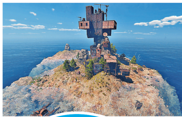
■《沉沒之地》允許玩家隨心建造生存之地。