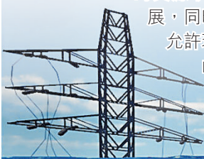
■當大部分城市被淹沒，人類要如何生存？

多樣化的建築功能是生存遊戲的一大體驗，建造自己的安全基地以及布置城防要素，讓小島化為在這飄零末世中的安心居所。無論是海上小屋、島嶼別墅還是堅固堡壘，遊戲的建設系統允許玩家建造各種形狀的基地。同時不要忘記建造高牆、鐵絲網、探照燈等設施保護你的基地免受變異人和海盜的攻擊，並可以架設重機槍、火炮等殺傷性武器擊退敵人的進攻，在末世中存活下來吧！