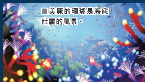
■美麗的珊瑚是海底壯麗的風景。

完成了這部充分還原迷人海洋的得意之作。除了一邊解謎一邊飽覽令人目眩神迷的海底風光，遊戲中還能收集各種道具，玩家們可以透過這些道具，了解各種海洋生物的知識和現實中珊瑚礁所面臨的生態問題，喚起玩家對海洋保育的重視。