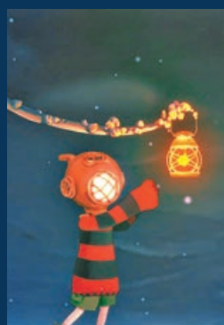
■主角小男孩穿越被污染的海洋。

「SAMUDRA」名字取自梵語，來源於印度教海洋之神「Samudradeva」的名字。《SAMUDRA》講述一個孩子穿越被污染的海洋，與神秘的海洋生物相遇相知，在成噸的可怖污染中探索深海污染的真相。遊戲開發團隊 Khayalan Arts 秉承對當地文化的熱愛與對自然的敬畏，將遊戲與宗教藝術結合，利用神像與圖騰指引玩家發現污染之源。值得一提的是，該團隊與印尼的環保團體合作，將部分利潤捐贈給當地的環保機構，以期在2025年前將印尼的塑料使用率降至原本的七成。