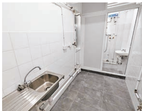
■單位內有廚房和浴室。

「聚賢薈」聯席主席、新民黨立法會議員陳家珮表示，「聚賢薈」早在2021年已經營過一個過渡性房屋，當時只有16個單位，已幫到15名兒童，今次26個單位於7月初開放申請，已接到252份申請，是名額的近10倍，目前已批出22戶，希望盡快處理餘下審批申請，讓有需要人士入住，餘下單位會優先考慮供居住環境惡劣、單親或有年幼子女的家庭入住。