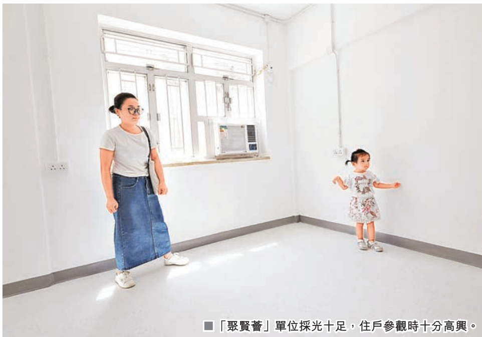
■「聚賢薈」單位採光十足，住戶參觀時十分高興。

位於銅鑼灣禮頓道的禮信大廈過渡性房屋「聚賢薈」昨日正式開幕，共提供26個單位，獲近10倍的申請宗數，單位面積均為200多平方呎，最快下月入伙。出席開幕禮的房屋局局長何永賢表示，項目由局方牽頭，資助非牟利機構營運，幫助基層人士改善生活環境，進而發展事業，成就香港的未來。有獲准入住的單親媽媽表示，獨自照顧兒子壓力沉重，居住環境好有助紓緩家長心情，為小孩提供更好的成長空間。