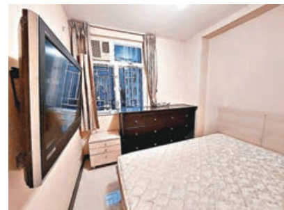
■主人房可放得落大床、掛牆電視和收納衣櫃。