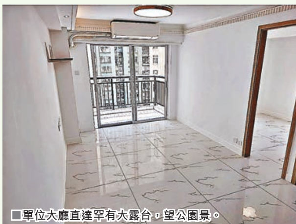
■單位大廳直達罕有大露台，望公園景。