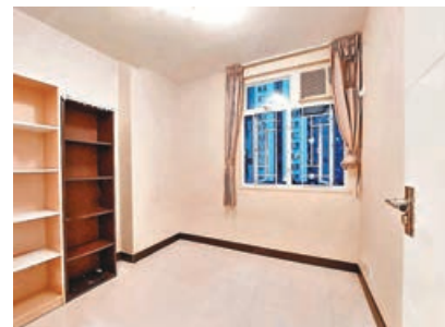
■睡房空間大，可放置書櫃或大型衣櫃。