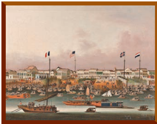
來自廣東省博物館的《廣州十三行商館》