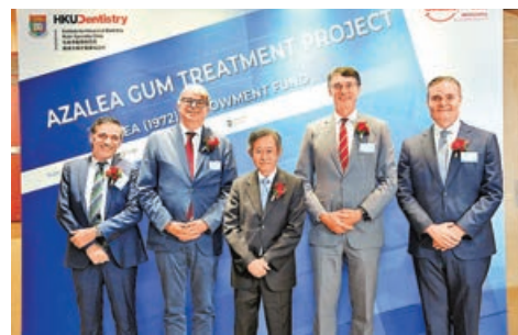
■一眾嘉賓及醫生出席「杜鵑牙周病治療計劃」啟動活動。

計劃主要針對後期牙周病的成年患者，現正領取綜合社會保障援助、收入不高於最新公共租住房屋入息限額或現時居住於公共租住房屋的人士皆符合資格申請。