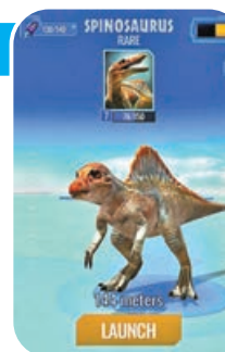
遊戲有百多種恐龍。

Pokemon GO, 因為玩家同樣是使用定位功能在真實世界中追蹤、探索、在特定的地點發現恐龍之後, 便能操控無人機獵捕恐龍。而除了收集以及創造不同品種的恐龍之外, 亦有對戰系統, 可以跟其他玩家對戰。