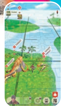
遊戲介面與 Pokemon Go 相似。

展開狩獵之旅。每場戰鬥限時最長為75秒, 其中充滿傳統芒亨風格的激烈戰鬥, 充滿趣味和混亂, 戰鬥結束會根據不同等級的評分獲取對應的獎勵。當玩家進行攻擊時, 碎片四溢, 武器和戰鬥方式都呈現出芒亨系列的特色。此外, 玩家可以根據喜好選擇橫向或縱向模式進行戰鬥。推薦大家使用橫向模式, 因為這樣視野更寬, 體驗也更佳。