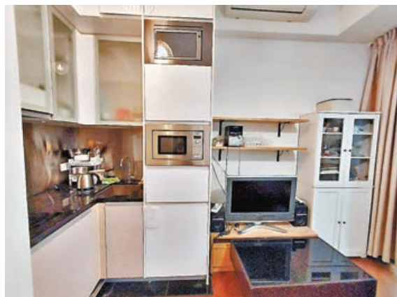
■開放式廚房位於客廳一角。