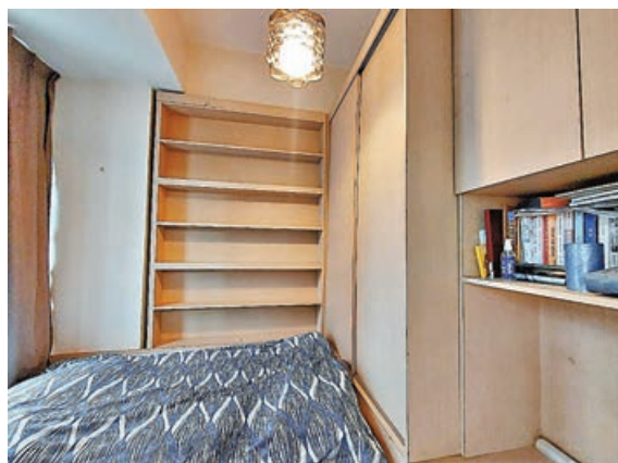
■睡房收納櫃及衣櫃充足。