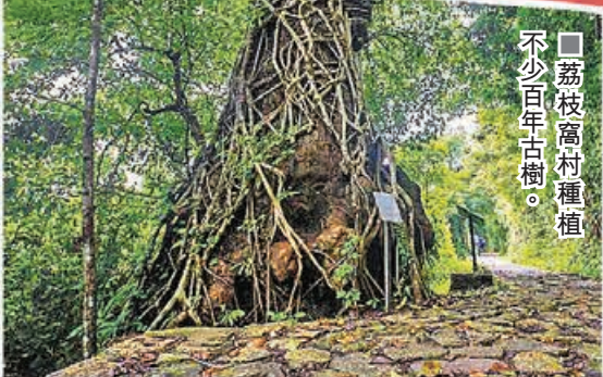
■荔枝窩村種植不少百年古樹。

2 由大埔墟站乘搭20R小巴或275R巴士至烏蛟騰，步行入荔枝窩，路程約2.5小時。