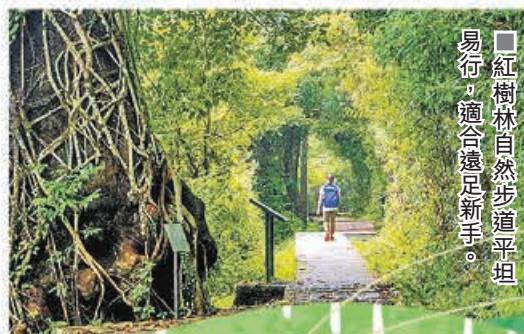
■紅樹林自然步道平坦易行，適合遠足新手。

荔枝窩村環繞住一條紅樹林自然步道，全長約1.2公里，平坦易行，適合遠足新手。四周一片綠蔭，空氣清新怡人，沿途會經過多個生態景點，例如白花魚藤林、風水林、田野、溪流等等。當中的銀葉樹林非常茂密，可以生長至約6米高，是全港最高大的紅樹品種，亦成為其他動植物絕佳的棲息地。而濕地泥灘則孕育了多樣化的海洋品種，為魚類及螃蟹提供庇護所和繁衍後代嘅地方，極具生態價值。