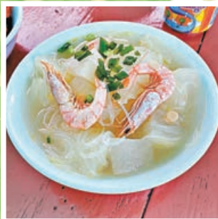
■冬瓜都是在荔枝窩種植。

去到客家古村，當然不少得品嚐地道客家菜。老闆為荔枝窩原居民，曾遠赴英國工作謀生，幾年前回流鄉村，開設明記茶座，將客家文化介紹給每一位客人。茶座大部分出品都是採用荔枝窩種植的天然食材，例如傳統家鄉荔香芋頭扣肉、客家炆豬肉、黃酒雞等等。茶座現時更推出打工換宿體驗，大家可申請於星期六、日及公眾假期到茶座幫手，負責樓面工作或者打理農務。體驗計劃將會包食宿，更會有貓貓主子監督工作，讓大家感受荔枝窩鄉村的簡樸生活及文化。