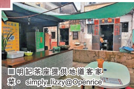
■明記茶座提供地道客家菜。 simply_lizzy@Openrice