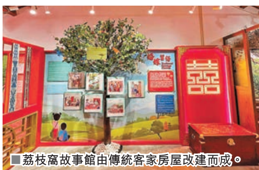
■荔枝窩故事館由傳統客家房屋改建而成。

如果想了解多年歷史的客家文化，可以參觀坐落於村落中心的「荔枝窩故事館」。故事館由傳統客家房屋改建而成，收集80多個村民口耳相傳的故事，再透過圖文並茂的多媒體及傳統展品，以四大主題向遊客呈現村民過往的生活模式和習慣。四大主題分別為「慶春約」七村村民生活作息、傳統醫術、客家歌曲及婚嫁習俗。客家人喜歡即興創作山歌，因此展板更會播放客家山歌的錄音，令遊客猶如時光倒流重返昔日。