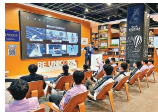
■ 人力市場轉趨活躍。