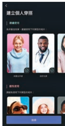
■ 跟着指示就能輸出理想作品。