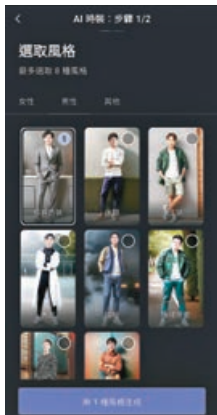
■ Vivid AI 圖像介面易上手。

人人都能利用簡單易上手的 Vivid AI，體驗將想像化為現實的樂趣！其中 AI 繪圖 / AI 圖像生成更是簡單易上手，只要簡單輸入敘述文字，就能透過 AI 生成精美圖片，它還提供 10 種以上好看的預設 AI 藝術風格。此外，用 Vivid AI 還能嘗試不同穿搭風格，利用頂尖 AI 為照片中的自己換裝，輕鬆又自然地套用上百種時尚服裝、飾品和帽子等，更精準調整或置換照片的背景或天空，將晴朗藍天變為浪漫星空、彩虹或極光等夢幻天空等，甚至可創造全新的場景、更換照片場景風格，營造出截然不同的氣氛，且用法簡單，操作容易。