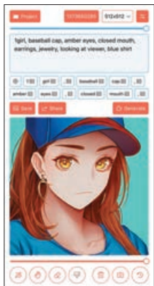
■ Draw Things 可在數分鐘建立影像。

如果產出的圖像沒有達到要求，就要不斷調整數值及 Prompt 等，大家還可以匯入其他人的 AI 作品，深度學習 Prompt，往後就能更易產出理想作品了。