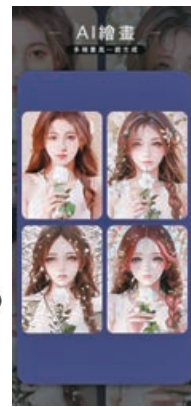
■ 美圖秀秀有不同的繪畫風格。

因此常常會產生意料之外的有趣圖片。它操作相當簡單，先點選 AI Art，接着點選導入照片加入想要 AI 辨識的圖片，然後等待幾秒鐘，AI 就會另外產出三種不同風格的圖片了！最後只要將圖片存下來就完成囉！