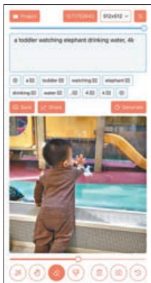
■ Draw Things 功能齊全。