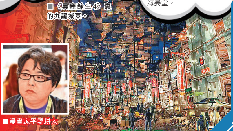
■《異塵餘生4》裏的九龍城寨。

從海晏堂正門西門外左右對稱的石階，中央的噴水池，到11間間的「工」字主體建築皆一一復刻，達到了以假亂真的地步。不過因為《逆水寒》莊園系統未提供十二生肖雕塑模型，該玩家暫用單一的其他動物模型代替。隨着官方上架更多莊園組件，想必有更多玩家發揮創意設計出更多作品。香港城市大學般哥展覽館正舉辦「盛世聚首 天寶芳華：圓明園獸首暨文物展」，推薦市民預約前往參觀獸首銅像原物和透過藝術科技沉浸式重返海晏堂。