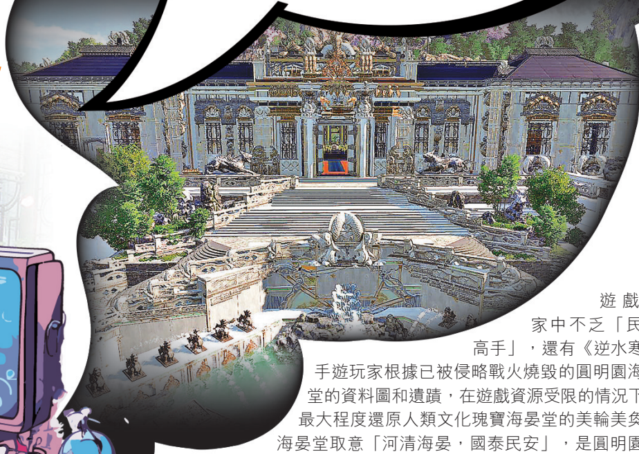
■玩家在《逆水寒》手遊裏復刻的海晏堂。