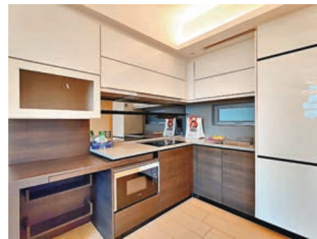
■開放式廚房設計簡潔，廚具及廚櫃齊全。