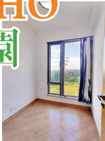
■小睡房同樣可望向公園觀景。