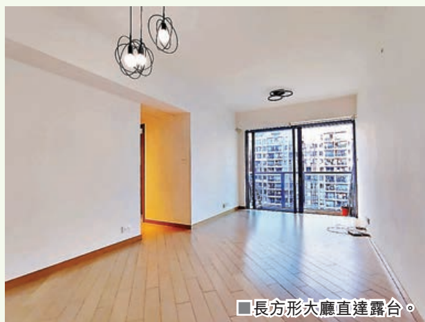
■長方形大廳直達露台。