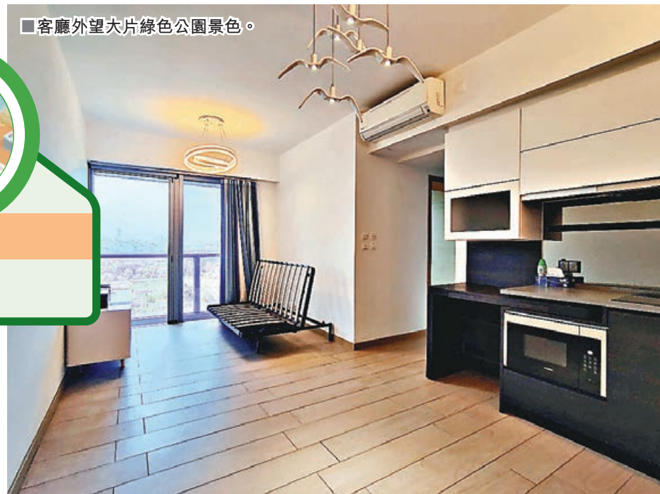
■客廳外望大片綠色公園景色。