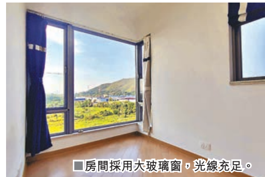
■房間採用大玻璃窗，光線充足。