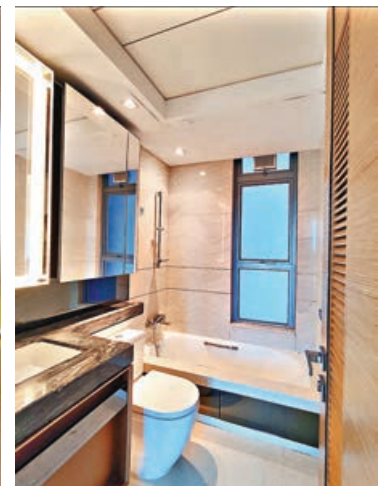
■浴室採用浴缸，配備大型浴鏡。