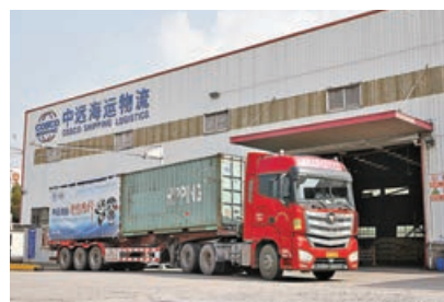
■第六屆進博會新西蘭及南太平洋地區展品日前順利抵滬。 資料圖片

據中新社報道，商務部副部長盛秋平23日稱，第六屆中國國際進口博覽會將於11月5日至10日在上海全面線下舉辦。百餘名世界500強和行業龍頭企業全球總部高管已確認來華參加進博會，規模創新高。