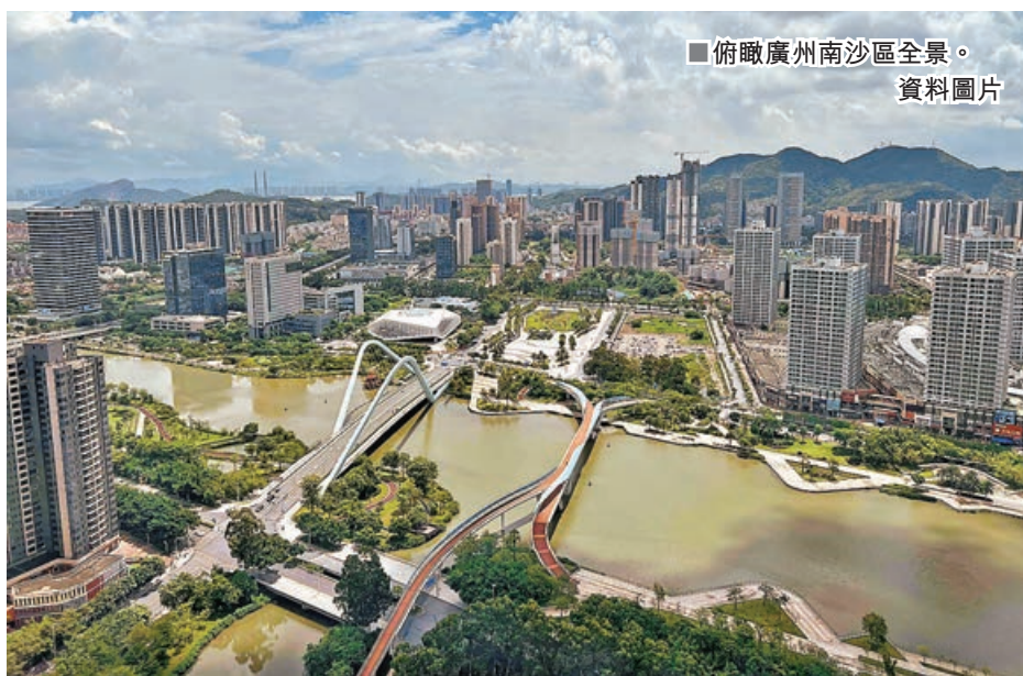
■俯瞰廣州南沙區全景。

為加快推動廣州南沙粵港澳重大合作平台建設，推動香港、澳門更好融入國家發展大局提供司法政策支持，最高人民法院23日印發指導意見，支持南沙完善與港澳規則對接，明確將強化數字經濟發展司法保障，探索建立港澳法律人才參與司法審判研究工作機制，並支持建立吸納港澳人才的司法智庫，還將提高涉港澳民商事案件辦理質量效率。最高法第一巡迴法庭負責人表示，這份《意見》推動健全涉外涉港澳糾紛解決機制，體現了新民訴法精神。