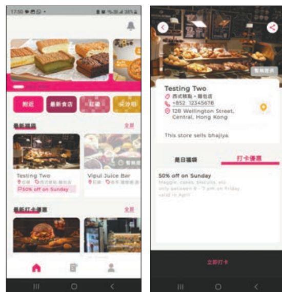
■ 提供最新「是日福袋」資訊。 ■ 也有「打卡優惠」。

下載及打開手機 App，先註冊成為會員，即可揀選心水商店及優惠，再以電子支付款項，就可以在指定時間內前往店舖自取。他們的合作商店遍布港九新界，包括 Boy n Burger、Paintable Cafe、星球蛋糕 SURPRIZE U、Bien Jamon Spanish Food Company、山下菓子 Kingsley 等，當中的優惠有「是日福袋」、「打卡優惠」，兩者無論是數量或價格，都會因應食肆及商店當天情況而有所不同，所以許多優惠都會好快售罄，而每次選購都可以有不同。想慳錢又想減少浪費食物，不妨注意有沒有心水食品發售！