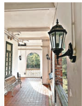
林邊屋將會是跑步團旅程的起點。

如果更傾向於輕鬆步行，漫步遊將是首選。參與者需要完成全程6公里的步行，無需跑步經驗。路線將從舊太古船塢起步，帶大家認識太古船塢和煉糖廠的歷史。中間將參觀葛量洪號滅火輪展覽館，感受香港舊式房屋的特色，並探索筲箕灣的戰時遺蹟和具有本土特色的歷史文化建築。最後，大家將步行進入前鯉魚門軍營，其中3座軍營建築已被列為法定古蹟，並在海防博物館結束這段充滿回憶的旅程。