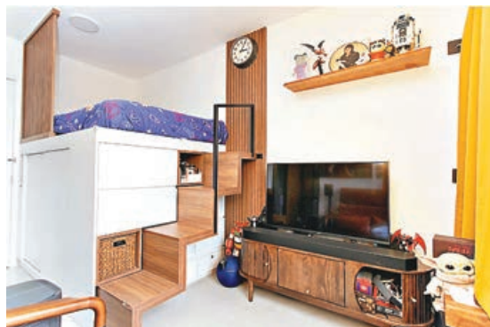
■高身儲物床的隱藏式樓梯。