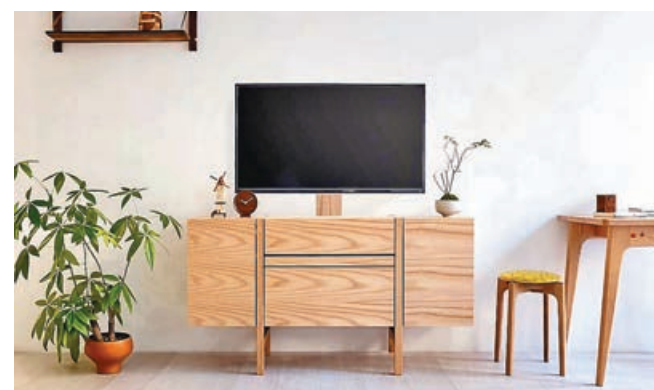
■日系新款電視櫃也可作一般邊櫃使用。