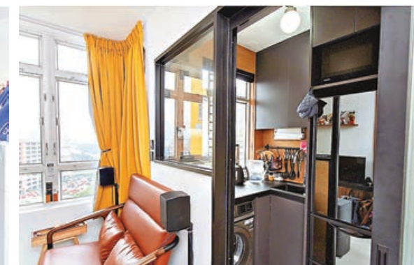
■廚房乃半開放式，設有窗戶及趟門。