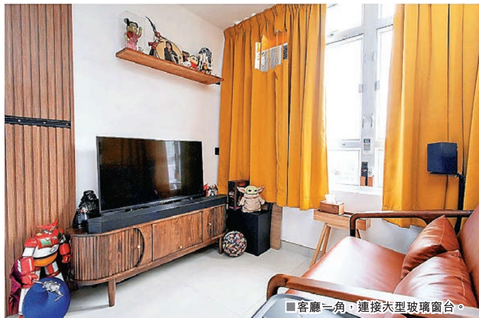
■客廳一角，連接大型玻璃窗台。

就算空間不多，一樣可以打造理想安樂窩！是次裝修單位為青衣居屋青富苑，間隔屬開放式，設計師 Maff 精心打造，度身訂造高身儲物床，睡床下方盡是收納空間，完美地解決開放式單位固有的收納問題，旁邊則是隱藏式樓梯作上落床之用，需要時才拉出完全不佔地方。而高身儲物床自然地劃分出就寢區及電視區，哪怕是開放式單位，在空間規劃上都可分明有序，溫暖舒適。