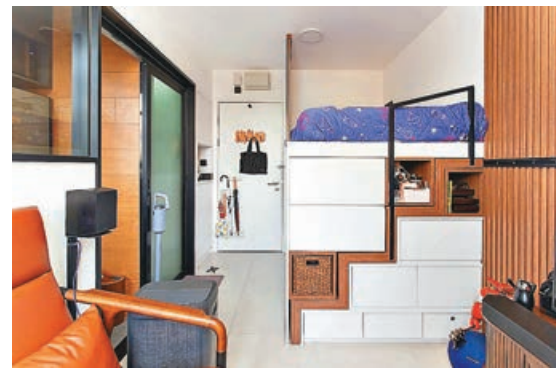
■高身儲物床下為一組收納櫃。