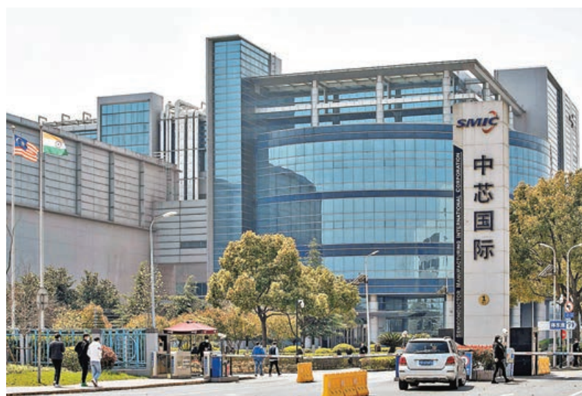
■北水沽騰訊買中芯。

港股在萬七點關口徘徊，市場觀望謹慎氛圍濃厚，焦點除了放在美聯儲議息結果之外，日本央行放寬收益率曲線控制力度不達預期，引發日圓兌美元進一步跌至近33年來低位，都是市場關注點之一。恒指昨跌10點，企在17,000點以上水平收盤，受制於好淡分水線17,500點以下，要注意仍未擺脫短線下探行情。大市成金額亦進一步縮減至不足700億元，顯示資金趁低抄進積極性較弱。