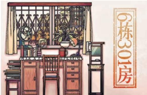
《6棟301房》喚起玩家對阿茲海默症患者的關注。

根據香港認知障礙症協會的數據，本港每10名70歲或以上長者就有1人患上認知障礙症，其中多達八成屬阿茲海默症。在去年的GWB大賽中獲得「社會價值獎」的《6棟301房》從患有阿茲海默症的老人視角出發，以獨特的玩法向玩家展現患者忘記一切美好記憶的過程。