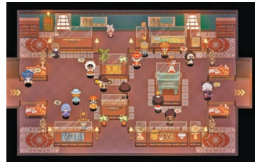
《九號博物館》遊戲畫面。

一些文物的介紹略顯單薄，讓遊客的觀賞體驗頗為枯燥，「如果文物背後有趣的故事能夠全方位地展現出來，遊客會不會更感興趣？」因此遊戲針對重要文物設計了諸多相關的玩法，通過線索一點點展開文物背後獨特的故事，等待玩家在遊戲中傾聽歷史文明的回響。