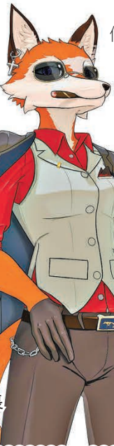
博物館館長是一隻狐狸。

今年GWB大賽設立全新「數字文化價值獎」，探索如何使遊戲兼具可玩性和數字文化傳承價值。近年越來越多年輕人熱衷於走進博物館，「看展式社交」成為網絡熱詞，在這種背景下，好玩又可以帶玩家「雲逛展」的《九號博物館》擊敗眾多對手奪得該項大獎。