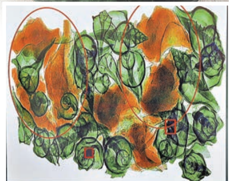
X光顯示「冰毒海螺」(紅圈示)影像與真海螺有異。

情報交流，聯手打擊販毒活動。根據紀錄，2022年10月香港海關檢查一個由墨西哥經海路來港，準備轉口往澳洲、報稱是椰子水的40呎貨櫃時，檢獲約1.8噸液態冰毒，市值約11億元，是海關破獲歷來最大宗的液態冰毒案。