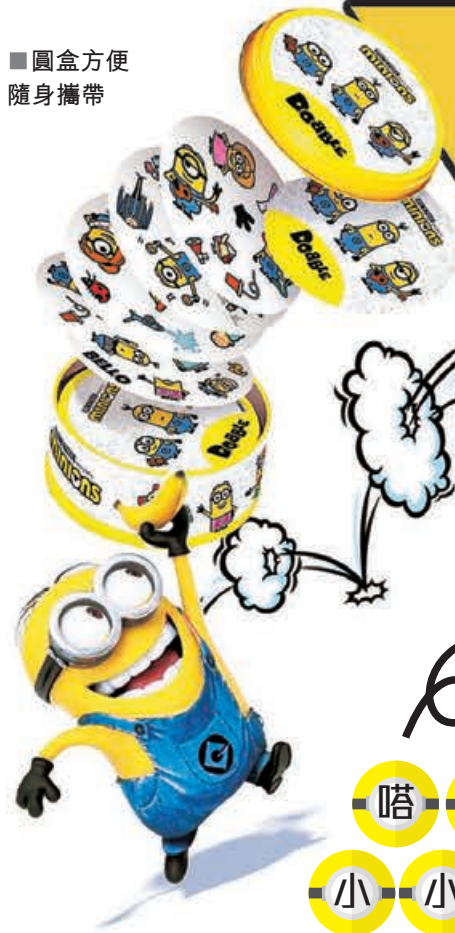
■ 圓盒方便隨身攜帶