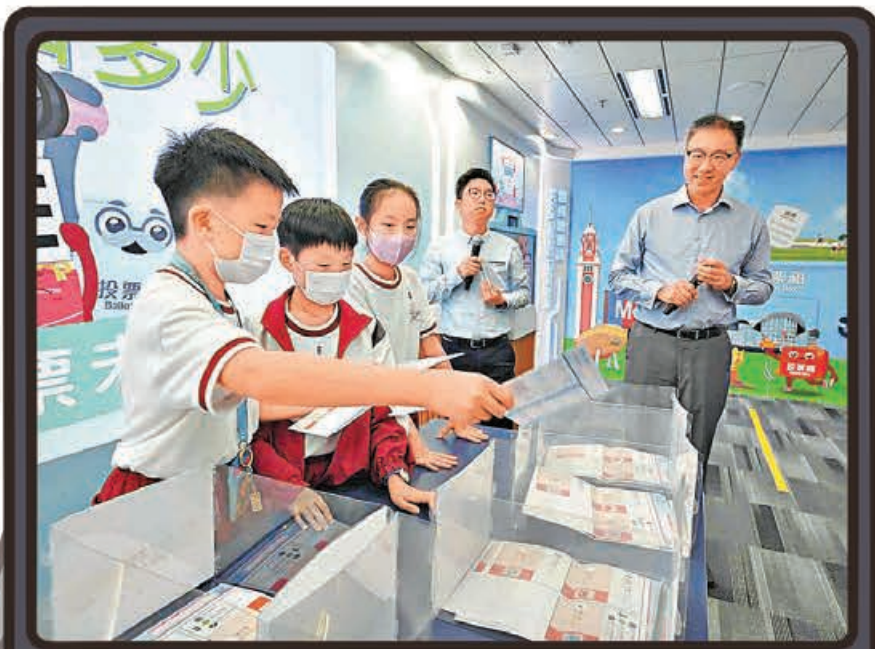
小朋友通過玩遊戲認識區選知識。