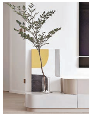
■電視矮櫃邊緣，可配置花瓶等擺設，倍添生活品味。