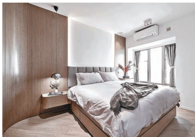
■主人房圓弧形衣櫃配合三邊落床大床，空間仍十分充裕。

ADO CASA 的設計理念體現了簡約美學和實用主義的結合，致力於創造舒適、實用和美觀的居住空間。他們著重於細節和質感的處理，為戶主提供輕盈流暢的生活體驗。他們通過簡樸而精心的設計，打造獨特而舒適的家居環境，讓人們在簡約中找到內心的寧靜和安逸。