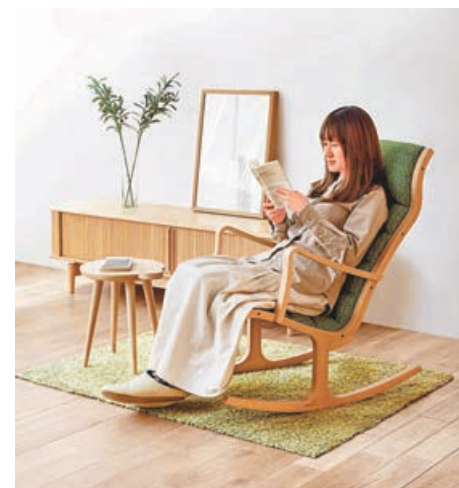
■日製搖搖椅，坐下看書，倍覺休閒舒適。