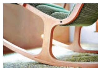
■椅子採用櫟木製造，承托力足。

今次介紹天童木工的搖搖椅 (Rocking Chair)，不僅工藝精湛，設計符合人體工學，以人性化的設計作出發點，椅子結實耐用，椅背和坐墊採用一幅過的防水面料，富承托力和通爽透氣，有效承托身軀，而椅子的材質乃櫟木，椅子尺寸：W58.2 x D85.3 x H93 SH42.8(cm)。