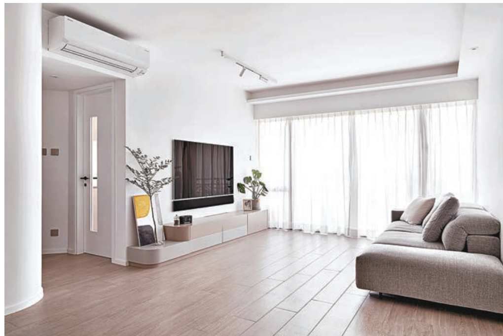
■客廳白色的牆身和窗簾，與灰色地板，充滿家的溫馨感覺。