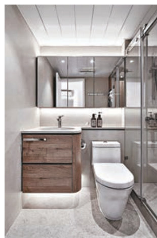
■洗手間梳妝鏡配合玻璃趟門淋浴間。