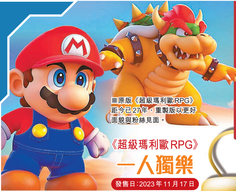
■原版《超級瑪利歐RPG》距今已27年，重製版以更好面貌與粉絲見面。