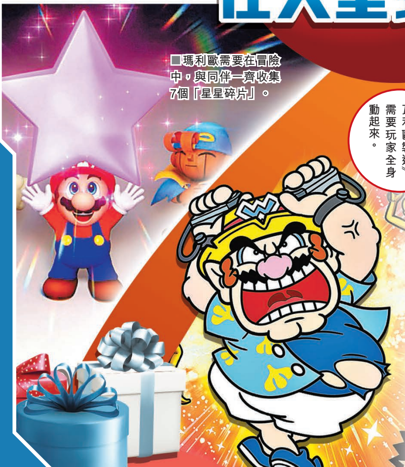
■瑪利歐需要在冒險中，與同伴一齊收集 7 個「星星碎片」。

為了救出碧姬公主，瑪利歐從遊戲開始便直奔庫巴的城堡，此時卻有一把巨大的劍從天而降，將所有人都打飛出去，出乎意料的劇情讓人開頭就忍俊不禁。為了拯救蘑菇王國，瑪利歐需要在旅程中收集 7 個「星星碎片」，並邂逅了不同能力的可靠夥伴，面對各種稀奇古怪、充滿創意的敵人。在動人的背景音樂中，踏上這樣一段迷人的冒險，《超級瑪利歐RPG》難怪影響了許多後來的瑪利歐系列作品。