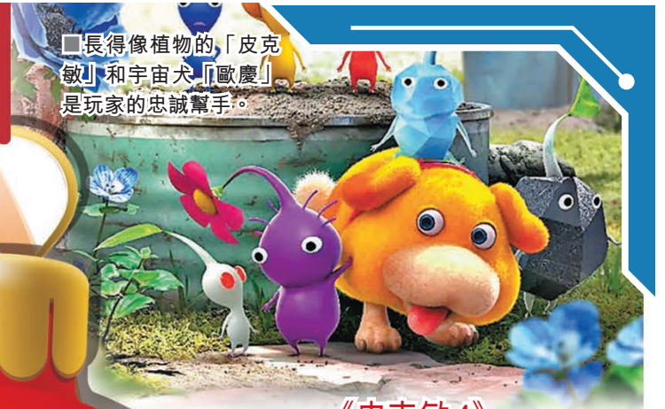
■長得像植物的「皮克敏」和宇宙犬「歐慶」是玩家的忠誠幫手。