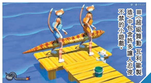
■《超級舞動 瓦利歐製造》中包含許多讓人忍俊不禁的小遊戲。