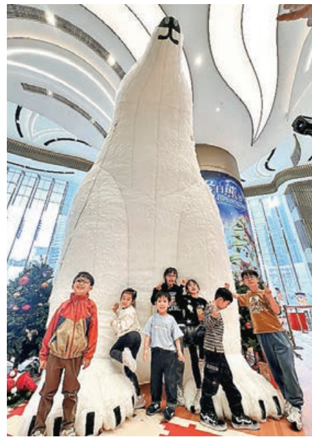
身高5米的「波士熊」最受小朋友歡迎，紛紛拍照留念。

間」打造聖誕氣氛，成功吸引人流。該活動設計一條「熊出沒路線」，以7隻形態不同的北極熊裝置貫穿市中心室內和戶外不同地點，包括公共運輸交匯處、花園平台等空間，讓市民依據設計的路線穿梭遊走。