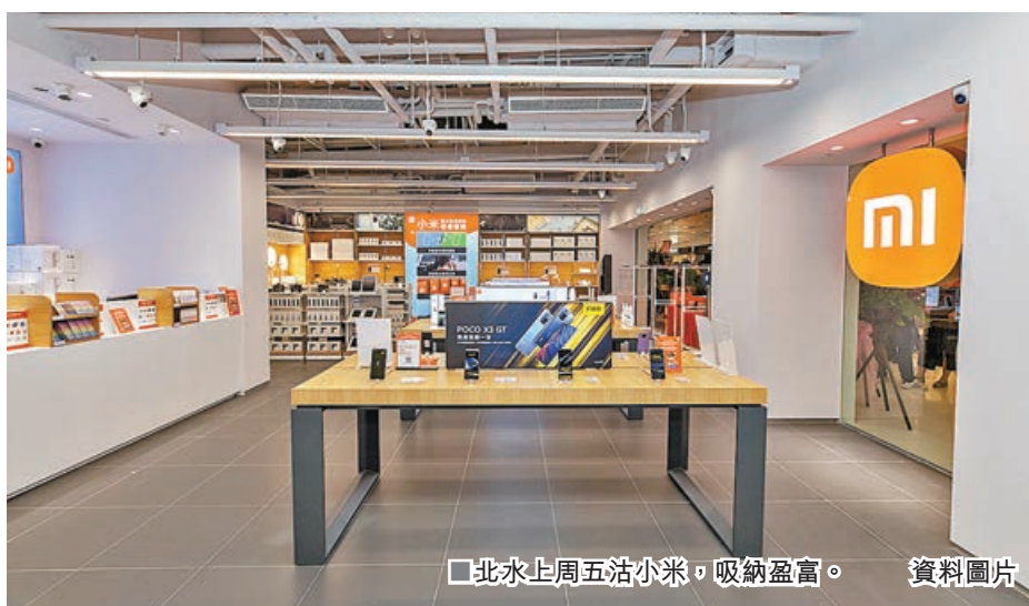
北水上周五沽小米，吸納盈富。資料圖片

港股震盪企穩，經歷最近兩周拋售殺跌後，大市已見止跌信號。恒指上周五(8日)微跌逾10點，繼續在16,300點水平收盤，成交額保持近900億元，惟未能達標，且低於年內日均成交額1,053億元。