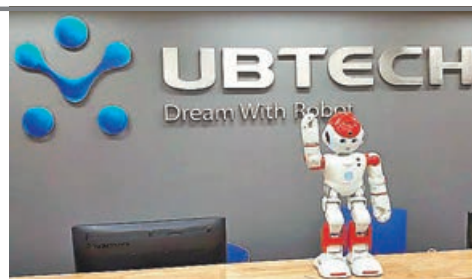
■優必選是港股「人形機器人第一股」，上市籌逾13億元。

圓心科技過去3年經調整虧損16.28億元人民幣，去年收入按年升31%至77.75億