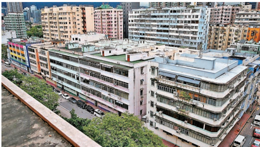
■政府冀加快私人業權統一，促進老舊樓宇重建。

發展局昨向立法會提交修例草案，建議降低強拍申請門檻，樓齡達50年或以上私人樓宇，門檻由現時業權80%下調到70%或65%，視乎樓齡組別。其中樓齡60至69年樓宇，如位於較具重建需要的「指定地區」，強拍門檻由現行的80%降至65%。樓宇樓齡達70年，不論地點，強拍門檻由80%降至65%。草案於2024年1月在立法會首讀和二讀，當局期望明年年中前獲通過。