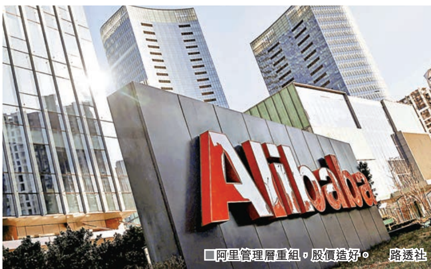
阿里管理層重組，股價造好。

港股昨低開後倒升收場，雖然隔晚美股三大指數均跌逾1%，但港股現時估值處於低水平，並具備見底條件，加上A股回穩，促使港股修復。恒指微升不足10點，以16,600點水平收盤，仍守在16,400點好淡分水線之上，保持穩好狀態，但需升穿17,000點大關才可以進一步強化回升走勢。