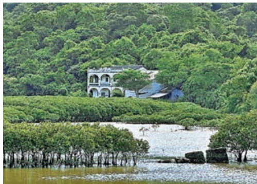
■啟才學校前面原本是一片金燦燦的蘆葦蕩，現在已被紅樹林佔據。