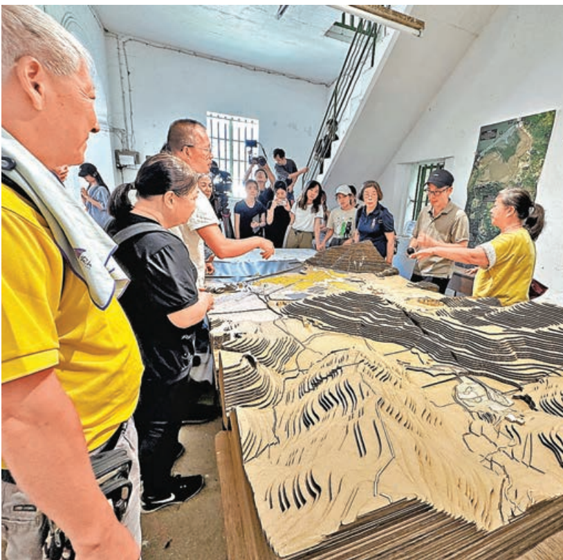
■谷埔村民為香港中文大學的團隊回憶村莊鼎盛時期的模樣。