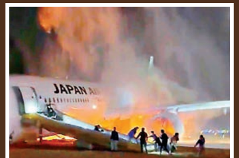
■乘客從滑梯逃生，當時客機部分機身已陷火海。