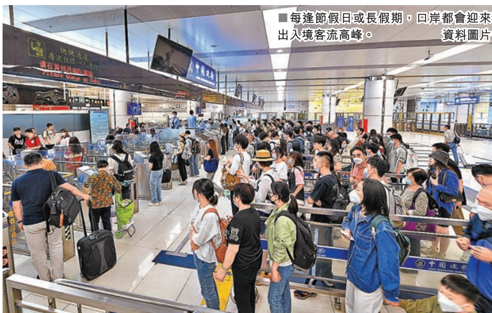
■每逢節假日或長假期，口岸都會迎來出入境客流高峰。資料圖片

跨年當晚，維港舉行歷年最大規模的跨年倒數煙花音樂匯演，吸引大批內地旅客來港欣賞。惟活動結束後，大部分過境口岸已關閉，只靠落馬洲/皇崗口岸疏導跨境人流，部分旅客通宵滯留香港。特區政府昨召開跨部門會議，全方位檢視今次事件，表示未來將會從三大方面改善大型活動後的跨境交通安排，包括：加強跨部門統籌，及早部署過關交通安排；與內地部門商討延長鐵路口岸開放時間，研究增加24小時通關口岸的數目；以及設立專屬跨境直通巴士的行車線，改善巴士流轉。