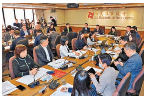
■油尖旺區議會昨率先舉行首次全體會議。

香港第七屆區議會全體470位區議員1月1日宣誓就任。在全港18個區議會中，油尖旺區議會昨日下午率先舉行首次全體會