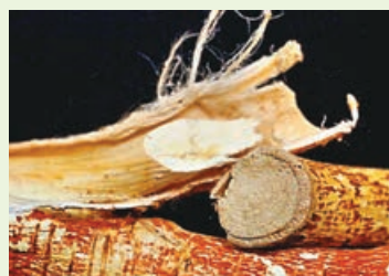
■五指毛桃的根表面呈紅棕色或棕色。