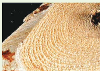
■五指毛桃的根木部橫切面有細密同心環。