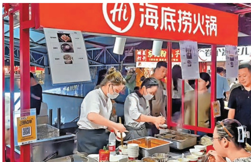
消費股昨普遍受壓。

港股昨在盤中一度下跌130點，低見16,516點，初步支持位16,600點繼續受考驗，但總算能夠守穩。大市成交處於