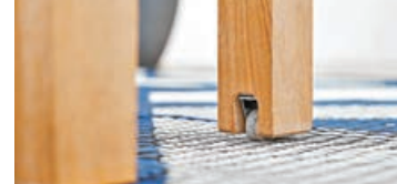
■枱腳的暗轆不會損害地板。

日本製伸縮枱 DAN Extension Table 開合非常簡單，只需在旁邊拉出來就可以，腳部的暗轆更不怕伸縮時對地板造成損害。餐枱伸縮幅度大，由四人枱變八人枱也沒有難度，伸延的長度更是按需要彈性拉出，安全易用。