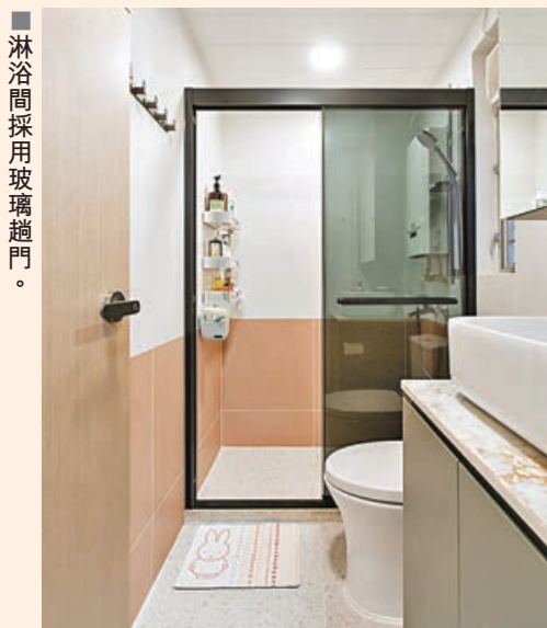
■淋浴間採用玻璃趟門。