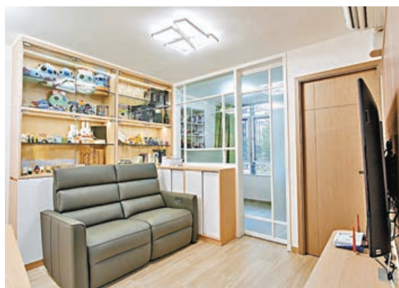
■其中一間房改用全玻璃間隔，增加空間感。