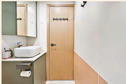
■洗手間續用蝦肉色作主調，配上深色洗手盆及廁櫃。