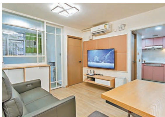
■客廳的電視牆配上特別的蝦肉色。