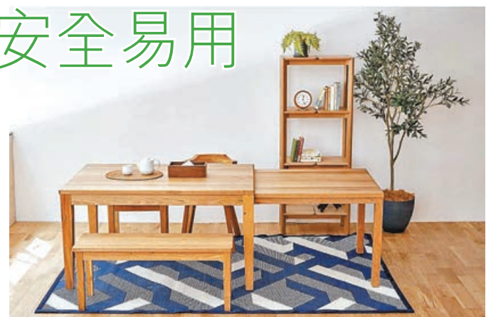
■餐枱伸縮幅度大，由四人枱變八人枱也沒有難度。

不少愛打邊爐的客人都很喜歡以上伸縮枱兩層式的設計，低一級的枱子最適合用來擺放火鍋料。有小朋友的家庭也非常喜歡用它來做小朋友書枱。