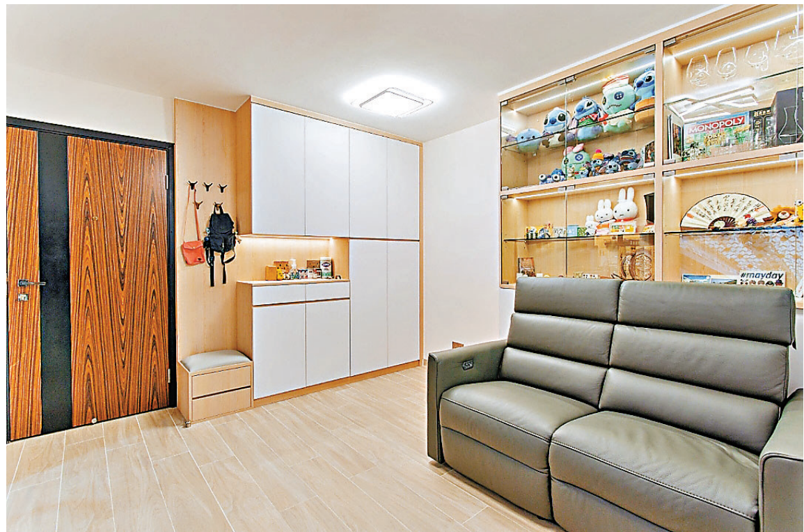
■大廳的C字儲物櫃及玻璃裝飾櫃，可大量儲物。