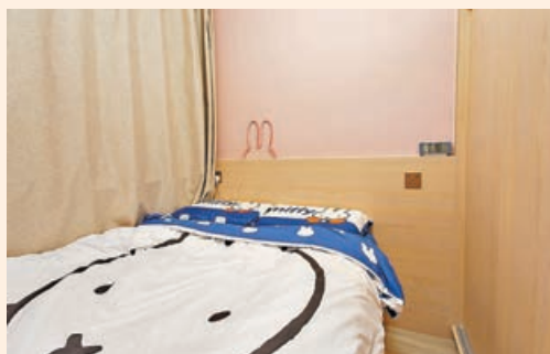
■睡房的牆以淺粉紅配襯木色，實在很搭。