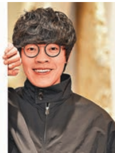
■盧廣仲期待跟港迷見面。

台灣歌手盧廣仲將於3月16日在紅館舉行《盧廣仲勵志的演唱會香港站》，他表示相隔13年再踏紅館，萬分期待。舉行香港演唱會前，他正籌備新專輯，預告會為香港站帶來不同驚喜。早前盧廣仲為香港個唱拍官方預告照時笑言：「臨近新年時期，大家可以期待一下啊！就像過年會開福袋，大家可以期待一下福袋裏的是什麼，抱住驚喜的心情迎接3月的演唱會。」而本月10日將先進行優先訂票。