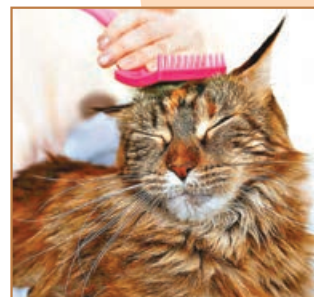
■ 主人要勤力梳理貓毛。

飼養緬因貓，要有每天梳毛的準備，以去掉表面的浮毛，避免毛髮打結，保持毛髮順滑。可以給緬因貓餵食一些含深海魚油成分的貓糧，也能起到減緩掉毛的作用。另外要留意季節交替的時候，也要有心理準備貓毛滿天飛的情況。