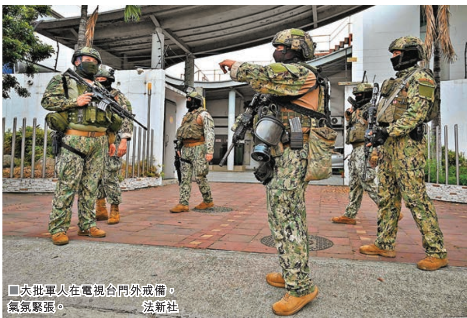
■大批軍人在電視台門外戒備，氣氛緊張。

厄瓜多爾一名「極其危險」的毒梟頭目周日（1月7日）從最高安全級別牢房越獄後，多所監獄發生騷亂，暴力浪潮更席捲全國各地。一批蒙面槍手周二闖入西南部瓜亞基爾市一家電視台，並挾持電視台工作人員。總統諾沃亞已簽署法令，宣布國家處於「國內武裝衝突」狀態。另外，中國駐厄瓜多爾使領館宣布，自周三（1月10日）起暫停對外辦公，開放時間另行通知。