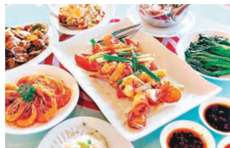
■ 於南丫島品嚐海鮮午宴。

另一個香港仔深度遊則包括同時探索南丫島。Klook 由即日起至 11 月 30 日，推出香港仔浪遊漁港 1773+ 南丫島海鮮宴（每位 590 元）。參加者先登上獨特觀光船，遊覽迷人而傳統香港仔漁村周圍的地標，觀光船上會提供精心設計的語音聲帶，讓你一邊在海上遊覽一邊聆聽漁村及相關歷史故事，生動有趣。隨後會參觀「香港仔曬家艇」海上博物館，親身體驗海上生活，觀賞漁民舊照片及物品。離開香港仔漁村隨即前往南丫島享用滋味得獎馳名海鮮午宴，以及踏上位於索罟灣的「漁民文化村」的大型魚排，全方位體驗香港漁民的歷史及文化。