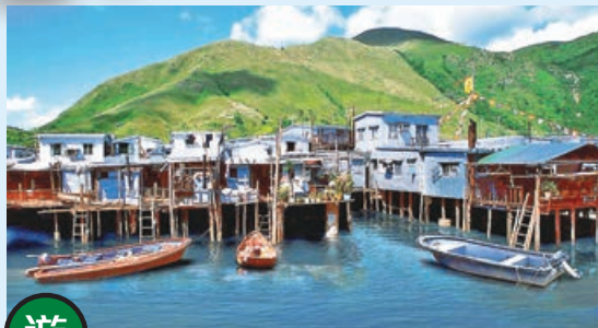
■ 欣賞大澳漁村的水鄉風情。