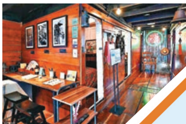
■ 於海上博物館參觀一系列展品。