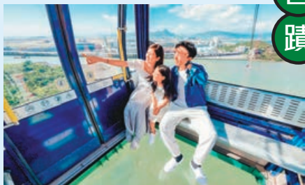
■ 乘坐擁有透明車底的水晶車廂，360 度俯瞰翠綠的北大嶼山郊野公園。

Klook 由即日起至 2 月 29 日，推出 360 大嶼山文化探索深度遊（每位 540 元），內容包括免排隊搭乘昂坪 360 纜車，居高臨下俯瞰翠綠的北大嶼山郊野公園，以及欣賞高達 34 公尺的天壇大佛，感受其莊嚴氣勢。其後可參觀歷史悠久的名勝古蹟寶蓮禪寺，深入體驗佛教文化傳統，再乘坐觀光遊船，遊覽大澳漁村特色棚屋。棚屋與縱橫交錯的水道形成獨特的漁村風情，更有多家攤檔及店舖供遊客選擇，成為大嶼山別具一格的旅遊勝地。另更可品嚐沙翁、大魚蛋及豆腐花等道地小吃。