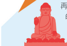
■ 大嶼山名勝寶蓮禪寺。

港人平日工作忙碌，為何不在假期來一趟悠閒的本地深度遊放鬆一下？由旅遊體驗預訂平台 Klook 推薦的漁村小旅行、遊歷水鄉等活動，大家可暫且遠離一下煩囂的城市，盡情探索清幽秘景。