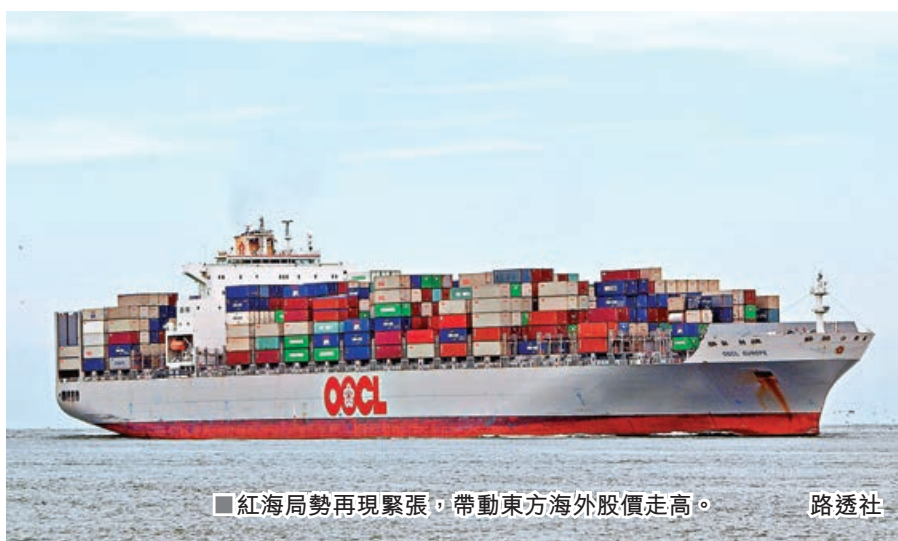
紅海局勢再現緊張，帶動東方海外股價走高。

港股上 周五(12日) 呈現買賣兩 閒局面。恒 指彈了一天 後，回跌近 60點，在好 淡分水線 16,300點以下收盤。大市成交金額再縮降至不足700億元，是今年以來最低單日成交量。